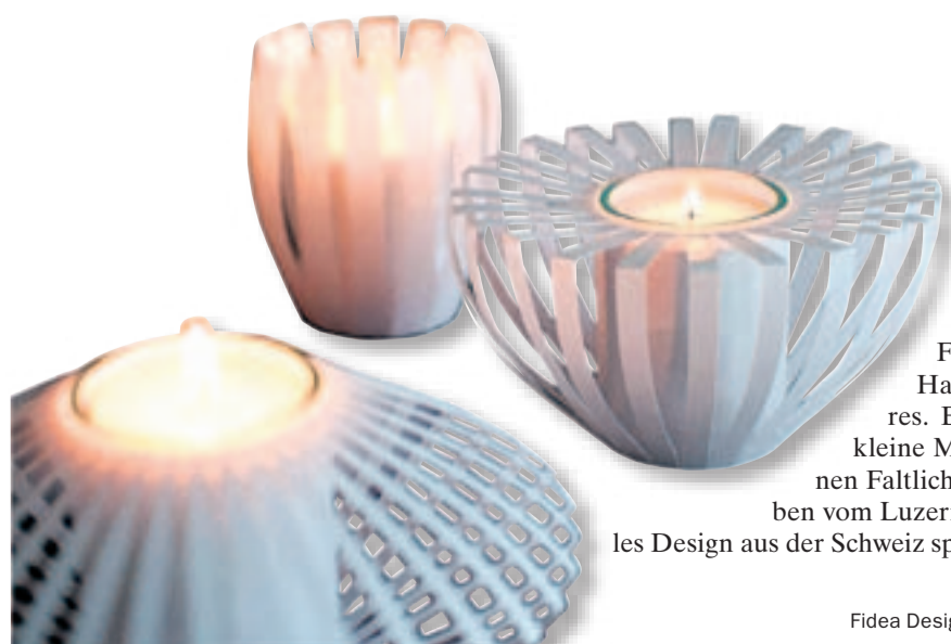
Faltlichter 1 bis 3 Fidea Design, Fr. 25.–, Kaufkaffee, Tössalstrasse 8, Winterthur. www.fideadesign.com