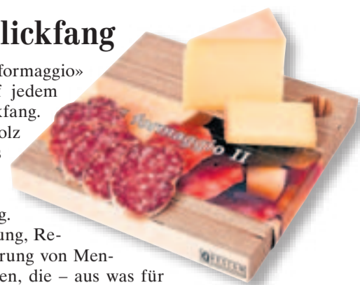
Schneidebrett Il formaggio II Quellenhof-Stiftung, 23x23 cm, Fr. 37.–, Q-Design-Laden, Barbara-Reinhart-Strasse, Winterthur, www.shop.qhs.ch Schön und Buch, Steinberggasse 52, Winterthur, www.schoen-und-buch.ch

Das dekorative Schneidebrett «Il formaggio» ist von Hand gemacht und auf jedem Tisch ein ganz besonderer Blickfang. Das Brett ist aus Birkenperspexholz und eignet sich auch sehr gut als Servierbrett. Hergestellt wird das Schneidebrett in der geschützten Werkstatt der Quellenhof-Stiftung. Sie engagiert sich für die Begleitung, Rehabilitation und Wiedereingliederung von Menschen verschiedener Altersgruppen, die – aus was für Gründen auch immer – am Rande der Gesellschaft stehen. Die Herstellung von Eigenprodukten an geschützten Arbeitsplätzen eröffnet ihnen die Chance auf soziale und wirtschaftliche Eingliederung. Gleichzeitig fertigen sie von Hand hochwertige Schweizer Designprodukte an.