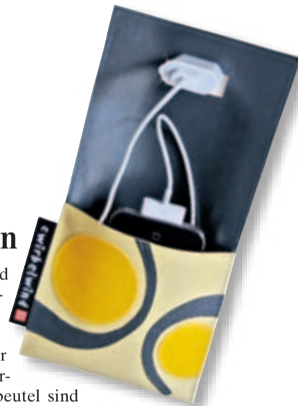
Handy-Aufladebeutel wirbelwind, zwischen Fr. 26.– und Fr. 36.– (je nach Anzahl Teilen), plus Versandkosten, erhältlich bei: wirbelwind, Tel. 079 221 96 33. www.wirbelwind.ch