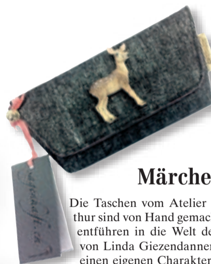
Handtaschen «Jagdfeiber» Artur, Fr. 98.–, kleinere Taschen ab Fr. 69.–, Atelier sagenhaft, Wiesenstrasse 3, Winterthur. www.sagenhaft.ch