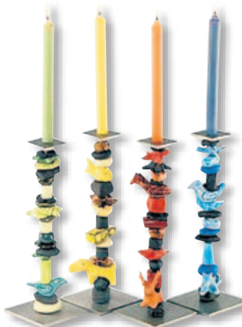
Abraka-Produkte Brühlgut-Stiftung Winterthur, Kerzenständer, 18 cm: Fr. 71.–, 30 cm: Fr. 91.–, Flaschenverschluss einzeln: Fr. 15.–, Auskunft und Bestellung, Brühlgut-Stiftung, Tel. 052 208 13 82. www.bruehlgutstiftung.ch

Kleine Enten, Vögel, Fische oder Seepferdchen: Die Tiere, die in der Keramikwerkstatt der Brühlgut-Stiftung in Winterthur Töss entstehen, sind unverkennbar. Hergestellt werden sie von einem Handwerker, der voll und ganz in der Welt der Tiere aufgeht und alle Tiere kennt. Neben den Abraka-Kerzenständern, die mit Tieren und abstrakten Figuren gestaltet sind, gibt es Totems (mit grösseren Tieren) sowie Flaschenverschlüsse. Neu sind die Verschlüsse einzeln erhältlich.