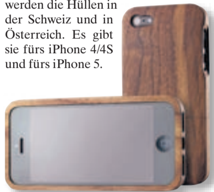
iPhone-Cover iDryad-Cover, Nuss, Fr. 89.–, Changemaker, Obertor 33, Winterthur. www.changemaker.ch

So wie jeder Baum einzigartig ist, so ist jedes «iDryad»-Cover ein Einzelstück. Nach griechischer Mythologie ist Dryade eine Nymphe, deren Schicksal untrennbar mit jenem des Baumes verbunden ist. Sie verkörpert die Seele eines Baumes. «iDryad»-Hüllen sind aus Vollholz. Sie unterscheiden sich nicht nur im Holz, sondern auch in der Masierung. Die Marke «iDryad» aus Biel will ganz bewusst einen Kontrapunkt setzen zu all den Produkten aus Plastik. Das Holz – Nuss-, Kirsch- oder Birnbaum – stammt aus nachhaltig bewirtschafteten Wäldern des Alpenraums. Hergestellt werden die Hüllen in der Schweiz und in Österreich. Es gibt sie fürs iPhone 4/4S und fürs iPhone 5.