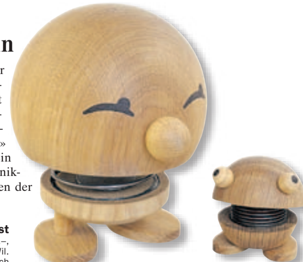
Eichenholzmännchen hoptimist 6 cm hoch, Fr. 37.–, 12 cm hoch, Fr. 82.–, Heimstätten Wil, Marktstrasse 55, Wil. www.present.ch

Er ist klein, passt überall hin und er ist nicht nur etwas für Kinder: Der «hoptimist» zaubert immer wieder ein Lächeln aufs Gesicht. Drückt man auf das kleine Männchen und sein Eichenholzköpfchen, hüpfet es fröhlich mit beiden Beinen in die Luft. Hergestellt wird der «hoptimist» in einer geschützten Werkstatt in Dänemark. Ein Teil des Verkaufserlöses geht an dänische Klinikclowns. In der Schweiz kann man ihn im Laden der Heimstätten Wil oder übers Internet kaufen.