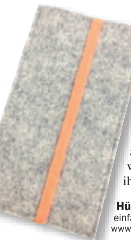
Hülle für iPhone 5 einfachFilz, Fr. 39.–, Changemaker, Obertor 33, Winterthur. www.changemaker.ch