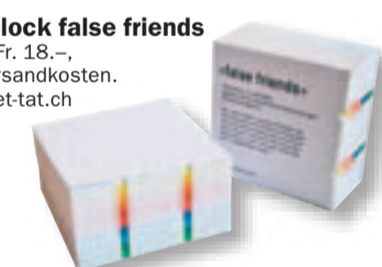
Notizblock false friends tät-tat, Fr. 18.–, plus Versandkosten. www.taet-tat.ch